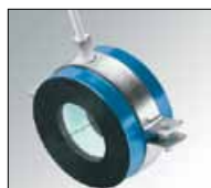
Obejmy Support Color z obejmą metalową