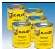
Farba K-FLEX Color