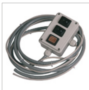
Zdalny kontroler nagrzewnicy (maksymalna odległość 5 m) Kod 02AC584