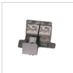
Puszka przyłączeniowa do komputera (na zamówienie) Kod 02AC585