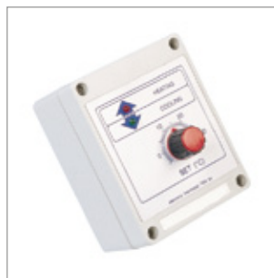
Elektroniczny termostat IP40 -5/+35°C wtyczka 90°, bez kabla zasilającego Kod 02AC52