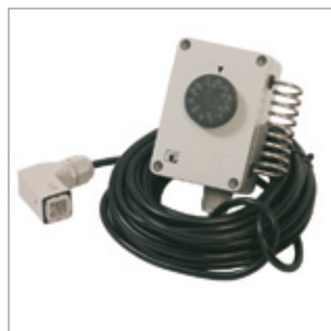
Wzmocniony termostat -5/+50°C, kabel 10 m, wtyczka podłączeniowa pod kątem 90° Kod 02AC582