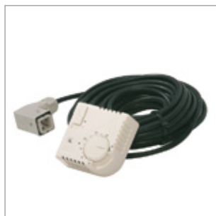
Termostat pokojowy +5/+30°C, kabel 10 m, wtyczka podłączeniowa pod kątem 90° Kod 02AC581