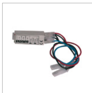
Przełącznik opóźnionego i sekwencyjnego startu Kod 02AC586