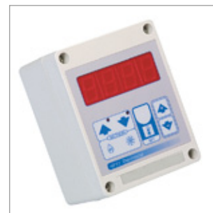
Elektroniczny termostat IP55 -10/+70°C z wyświetlaczem, bez kabla zasilającego i wtyczki Kod 02AC294