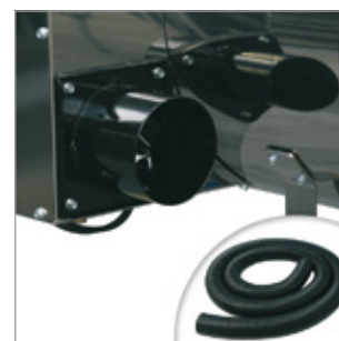
Wlot świeżego powietrza Kod 02AC535 Ø 100 mm Kod 02AC581 przewód 5 m Ø 100 mm