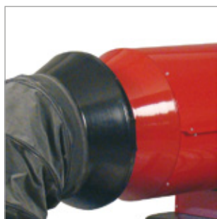
Adapter do podłączania przewodu powietrznego Kod 02AC501 Model EC 32 / Ø 300 mm Kod 02AC502 Model EC 55 / Ø 350 mm Kod 02AC503 Model EC 85 / Ø 400 mm