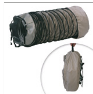
Elastyczny przewód powietrzny (6 m) z klipssem Kod 02AC562 Ø 300 mm Kod 02AC563 Ø 350 mm Kod 02AC564 Ø 400 mm