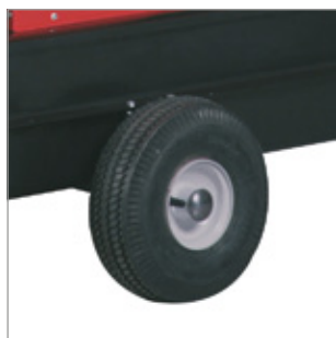
Pompowane koła Ø 250 mm Kod 02AC598 dla EC 55 Kod 02AC599 dla EC 85