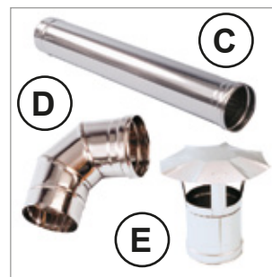
C) Rura ze stali nierdzewnej do układu odprowadzenia spalin L=1 m Kod 02AC420 Ø 120 mm Kod 02AC285 Ø 150 mm