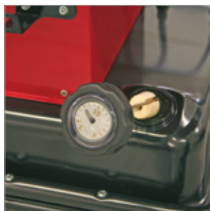
Wskaźnik poziomu paliwa Kod 02AC508