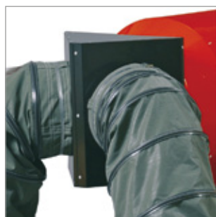
Adapter do podłączania dwóch przewodów powietrznych Kod 02AC546 Model EC 55 / Ø 300 mm Kod 02AC505 Model EC 85 / Ø 350 mm