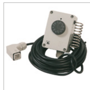
Wzmocniony termostat -5/+50°C, kabel 10 m, wtyczka podłączeniowa pod kątem 90° Kod 02AC582