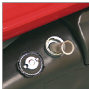
Filtr wlewu paliwa Kod 02AC556