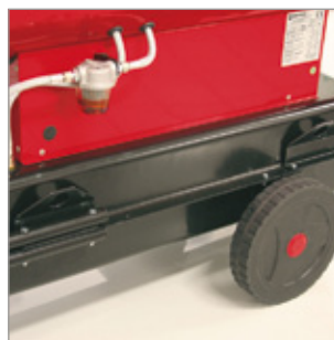
Uchwyty do przenoszenia (4 części) Kod 02AC511 Model EC 55 / EC 85