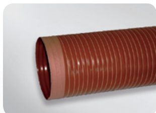
Wersja z mufami Master SIL 1 K