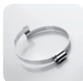
Obejma Clip Grip